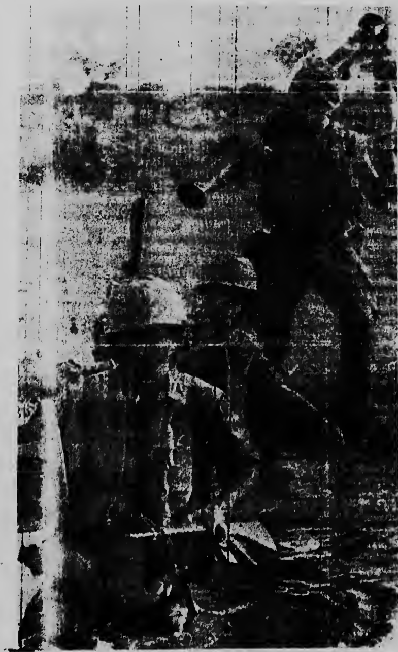
Teniendo nan arma haltu pa no muha, soldanan norteamericano ta crusando un riew chikitu durante e operacion Beat Rite, cu a tuma lugar 30 milla di Da Nang. Luná pasá e soldanan tabata exitoso den nan campanja contra e comunistanan

LIMA--UPI--Cancillernan americano ta bai emiti un pronunciamiento y esei ta necesario cu su palabra sea kiribi, si ta posible cu e tinta indeleble di unanimidad", asina e diario di comercio a bisa den su editorial di ayera respecto e reunion di consulta di e cancillernan convoca pa consejo di organizacion di estado nan americano (OEA) pa trata riba e denuncia di Venezuela contra Cuba. E periodico ta bisa cu den e oportunidad aqul a ser yama e reunion di atendimiento, cu aplicacion dje articulo nan 39 y 40 dje carta di OEA cu ta parce di ta unanime den tur cancelleria y ta senjala cu e aplicacion dje articulo sexto dje asistencia reciproca di Rio de Janeiro lo a precipita e debate te na un caja sin salida y ningun hende ta ignora cu talvez esei lo por tabata e carta di triunfo dje Castrismo". E division dje republicanan a anja di den bandanan cu ta adopta posicionnan discrepante en cuanto e eficacia dje sistema di defensa contra infiltracion arma e ideologica di mundu comunista cu a laga tras sabor amargo di derrota pa e quejo hustu di Venezuela.